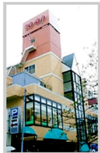
生協生活文化会館 外観