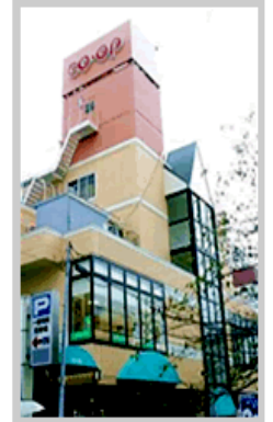
生協生活文化会館 外観