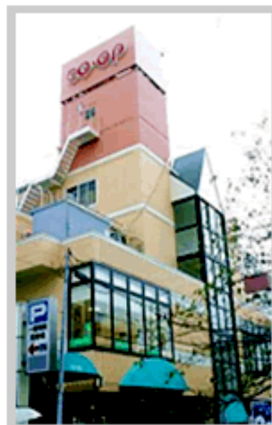
生協生活文化会館 外観

生協生活文化会館 (コープあいち・コープ本山店) 2F 地域と協同の研究センター